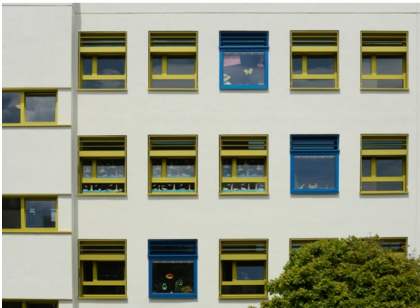
Ausschnitt Fassade nach Sanierung (VITRINENFENSTER für Selbstdarstellung), © Gruber + Popp Architekten

DE-82110 Germering | Realisiertes Projekt